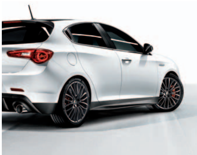
Side skirts DIS. 50903505