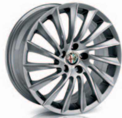
Turbina Alternatief in Pack Sport 3 (optie 5RH)