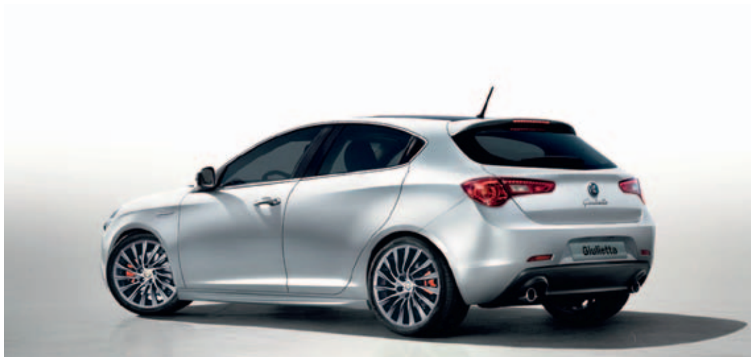
Pack Sport 3 met 18" velgen Turbina (optie 5EE, 732) en rode remklauwen (optie 4SU)