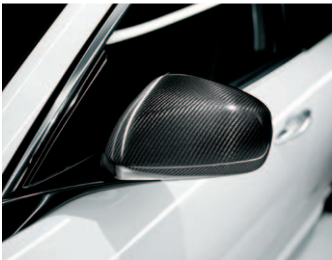
Buitenspiegelkappen carbon DIS. 50903353