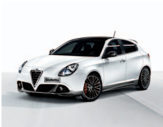
Sportieve voorbumper DIS. 50903311