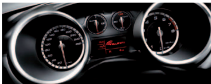
Blue & Me: Onderdeel van Pack Premium