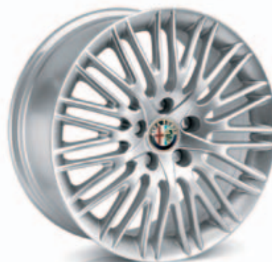
Elegante Multispoke Optie 433