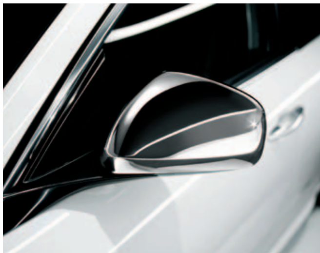
Buitenspiegelkappen chrom DIS. 50903297