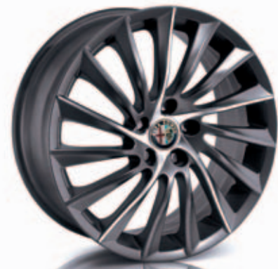
Turbina Titanio Optie 55E