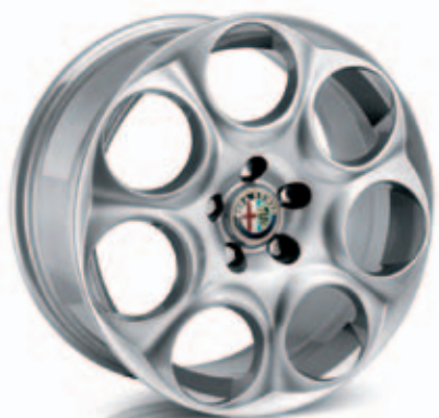
Super Sport Optie 421