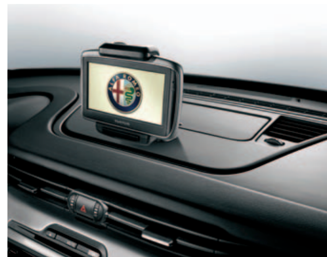
TomTom-navigatiesysteem in combinatie met optie 68R DIS. 71805994