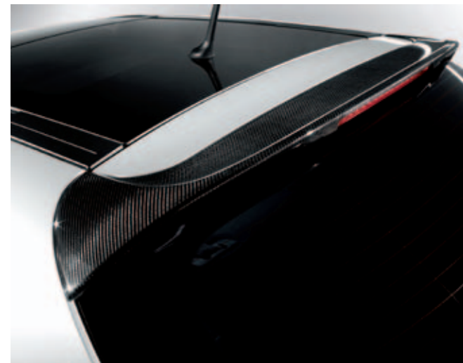
Achterspoiler carbon DIS. 50903308