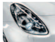
Pack Business Plus