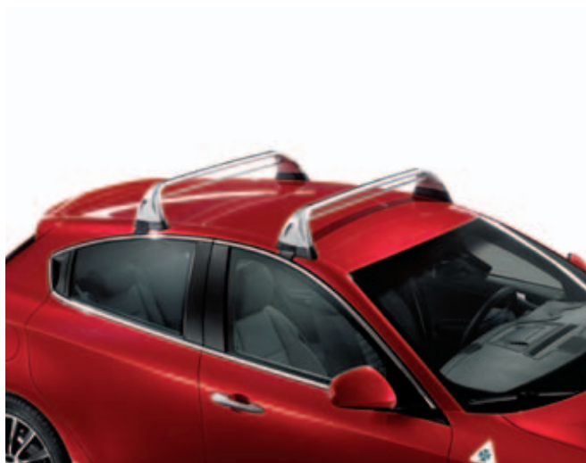
Dakdragers DIS. 50903328