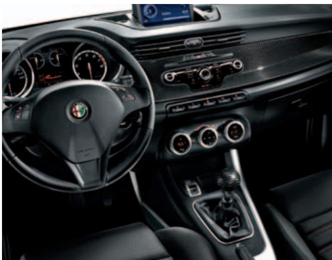
Dashboardinleg in carbon DIS. 50903315