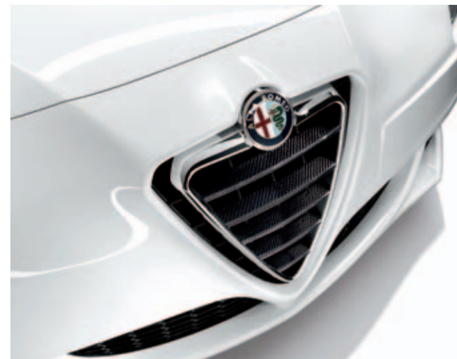
Scudetto in carbon DIS. 50903494