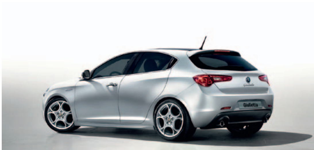
Pack Sport 3 met 18" velgen Sport 8C Competizione (optie 5RJ, 732)