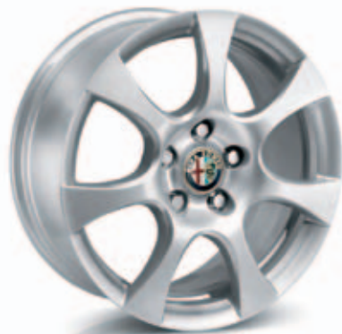
Elegante Optie 431