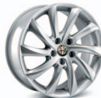
Sport Plus Standaard in Pack Sport 1 en 2