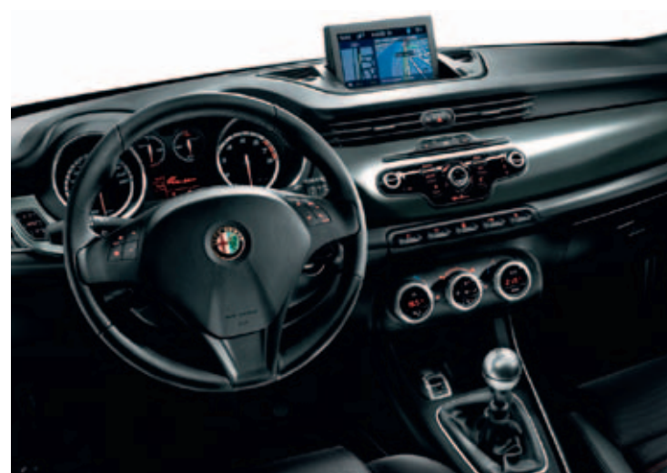
Dashboard donker geborsteld aluminium (standaard i.c.m. Pack Sport 2 of 3 en op QV)