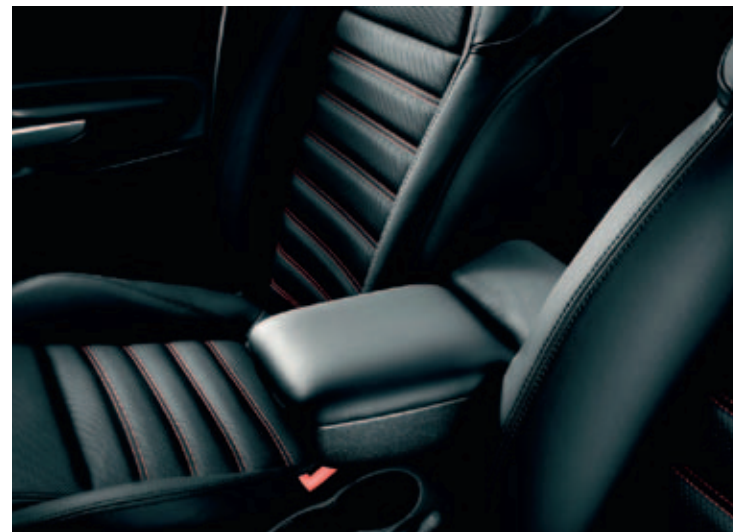
Volledig lederen bekleding in combinatie met Pack Sport 2 of 3 (optie 212)