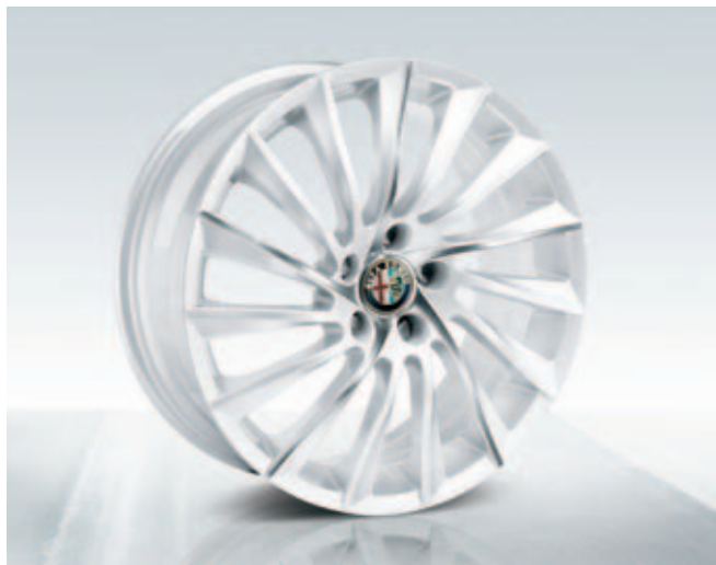
Lichtmetalen velgen 18" Turbina (wit met zilver) DIS. 50903314