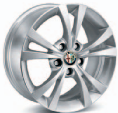
Sport Optie 432