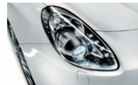
Bi-xenon koplampen inclusief adaptieve bochtverlichting: Onderdeel van Pack Premium Plus