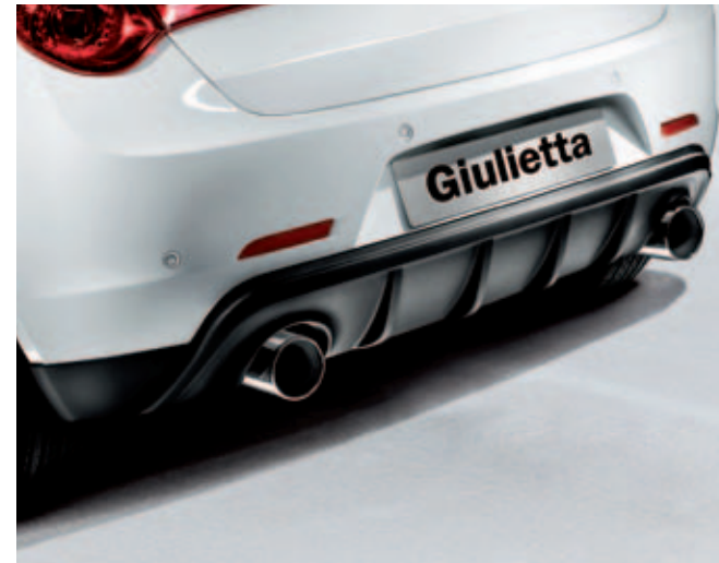
Diffuser achter i.c.m. uitlaatsierstuk DIS. 50903516 en 50903312