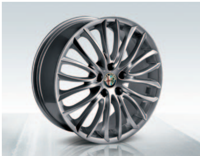
Lichtmetalen velgen 18" Sport 8C Spider (licht of donker) DIS. 50903313