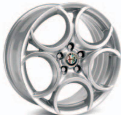
Sport 8C Competizione Standaard in Pack Sport 3 (optie 5RJ)